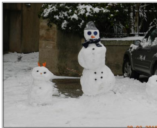
le 28/02/2018 exceptionnel épisode neigeux