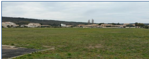
Bassin de rétention du Bellevue

Les crédits nécessaires à ces travaux sont inscrits au budget primitif de l'année 2016.