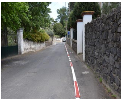
Avenue Achille Levère

Après une période test de 6 mois et le recueil de l'avis des riverains, il a été convenu de retirer la chicane rue des Rouyres. Le marquage du stationnement rue de l'égalité a été finalisé.